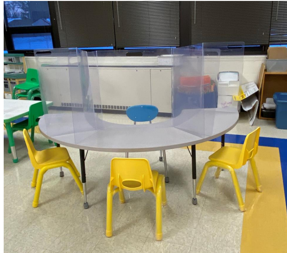
Reporte del Superintendente | 26 de enero